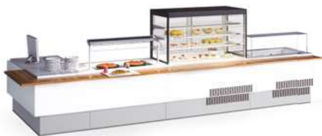
Vitrinas Servery counters